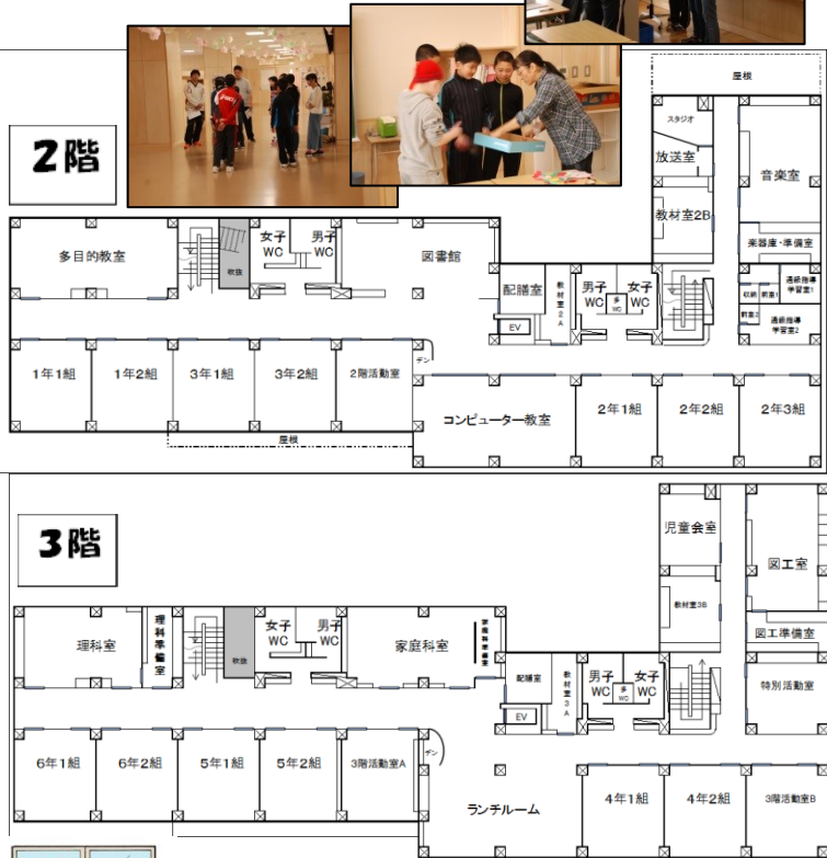
平成29年度教室配置

6年生は、入学式の裏方として作業や、2年生と入学式に臨んだことを忘れずに自分たちの最後の1年をスタートさせました。江別第一小学校2回目の歴史が幕を開けました。