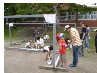
サッカーゴールペンキ塗り

昨年度は、サッカーゴールのペンキ塗りを親子で楽しく行いました。今年も楽しい企画を考えておりますので、是非、たくさんの皆様のご参加をお待ちしております。