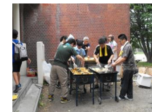
友愛セール(焼き鳥・焼きそば)