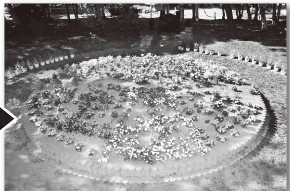
○気球デザインで植えられた花壇