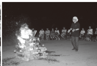
○キャンプファイヤー