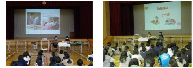
当日の様子。みんな真剣に話を聞いていました。

これからも、安心・安全の確保の基に、学びを保障し、子供たちが成長する場を設定していくことが大切になってきます。本校としては、これまで通り、消極的になることなく、できることをしっかりと見極め、教育活動を充実させていきます。