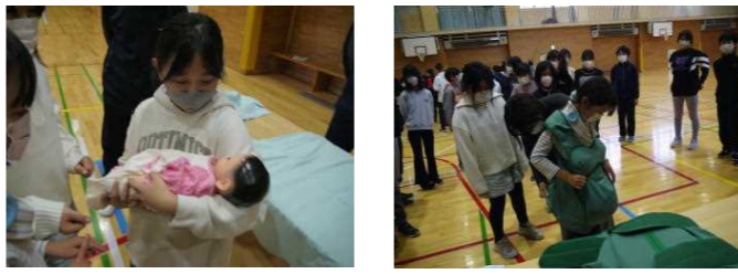
赤ちゃんの人形を抱いたり(左)妊婦さんを体験(右)しました。

5年生は講師のお話を聞いて「自分の母親にあらためてありがとうと伝えようと思いました。」「助産師さんの仕事を知ることができてよかった。あらためて命の大切さを知ることができました。」などの感想を書いていました。