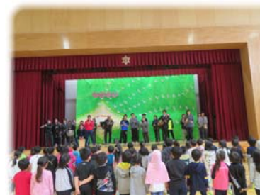
教職員バンドで「さんぽ」の合唱