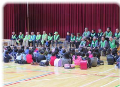
5/15 交通指導ボランティアの皆様との対面式