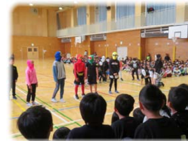
5年生 悪の軍団を倒す太レンジャー