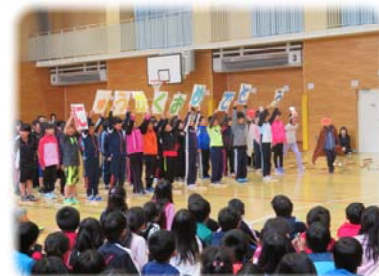
4年生 アンパンマンの学校紹介