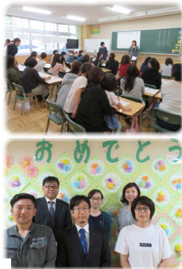
今年度PTA役員の皆様

いよいよPTA活動が本格スタートします。子ども達の学習環境を整えたり、会員の皆様の交流を深めていただいたりしながら楽しく活動を進められるよう、保護者の皆様にはお世話になりますが、よろしくお願いします。