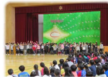
1年生 かわいい歌と踊り

全校で1年生を喜ばせてあげようと、とても温かな雰囲気での集会となりました。これからも「思いやりいっぱい」の江別太小学校を続けていきます。