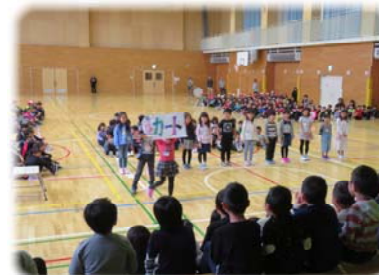
2年生 学校クイズ、歌