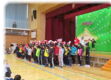
6年生 運動会応援合戦