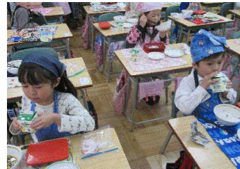
【1年生の給食の様子】

新1年生69名を迎え、4月7日(火)から、令和2年度の教育活動のスタートを切ったところですが、4/12(日)に道・札幌市緊急共同宣言が出され、昨日は国の緊急事態宣言が全国を対象となるなどした結果、江別市も4/20(月)～5/6(水)まで、休業を取らざる終えない状況となった次第です。この2週間、各ご家庭のご協力のお陰で、欠席や出席停止児童も、日々、数名といった状況で、各クラスでは、遅れた学習を取り戻そうと一生懸命に学習に取り組む姿が見られていたので、残念な一面もありますが、前回の休業同様、家庭での生活習慣や学習習慣の定着に向け、家庭と連携し、学校として可能な限りの支援を行ってまいりますので、来週からの個人懇談(予定通り実施)では限られた時間ではありますが、子どもの状況などについての情報連携を密に行っていただけると幸いです。また、詳細は、後日ご連絡いたしますが、夏休み前までに計画されていた 集団で行う行事や学習活動(運動会や宿泊学習等) は、基本的に夏休み以降の実施への変更を予定しておりますので、ご理解の程、よろしくお願いいたします。