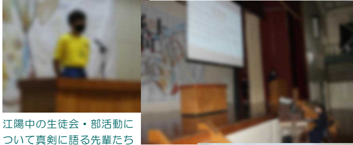
江陽中の生徒会・部活動について真剣に語る先輩たち

集会の終わりには、A組の〇〇〇〇さんが新入生を代表して御礼と決意の言葉を述べました。