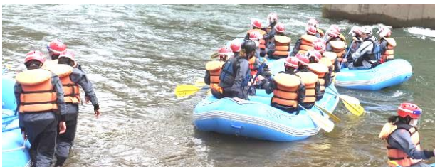
ラフティングに出発

ギガスクール端末の中のプレゼンテーションアプリを活用し、自主研修のまとめを28日（金）に学級発表会を実施しています。また、学年の発表会はネットワークを活用し、6月3日（水）に実施する予定です。