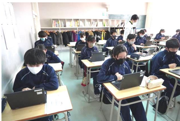
それぞれ自分のアカウントとパスワードを入力します