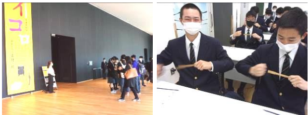
ウボボイでの学習の様子