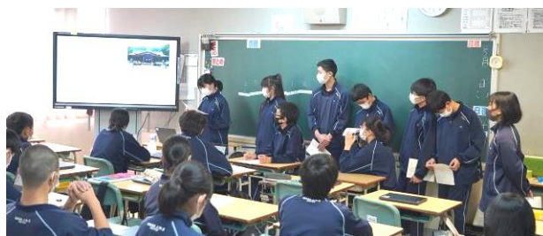
3年生修学旅行の自主研修プレゼンテーション