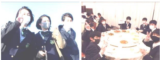
大沼での遊覧船と夕食風景