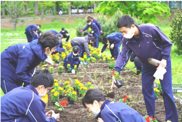
花壇に花を配置している様子