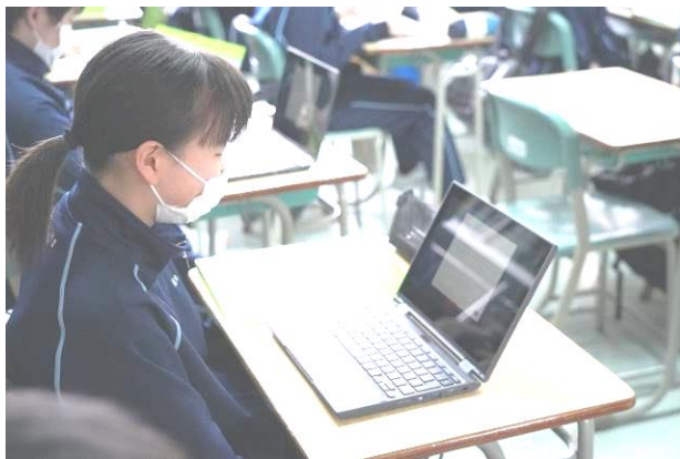
はじめて端末を起動しました（1年生）

5月11日（火）に1年生と3年生に、5月14日（水）に2年生にGIGAスクール構想の端末の配付と、生徒一人一人のGoogleアカウントを入力するなどのセットアップ作業を実施しました。この作業により端末を活用して学習に活用する準備ができました。セットアップが終わったら各学級の仮想のクラスルームにログイン。アンケートに回答すると結果がすぐにグラフ化されるなど学習の仕方にも夢が広がります。