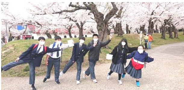
さくらの前でミッションポーズ