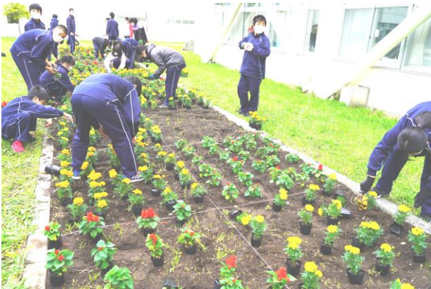
だいぶ配置が終わりました

5月28日（金）の放課後に全校の整美委員会による花壇作業が実施されました。この花壇作業は「地域一体型・学校顔づくり事業」の1つとして実施されます。整美委員の皆さんが楽しそうに花を配置して植えていきます。今年度はチェック柄の花壇をつくりました。植えただけではきれいに維持できません。雑草抜きや咲き終わった花を摘む作業も今後続いていきます。大麻中学校の前を通る人たちが校庭の花壇を見て気持ちを和ませてくれるとうれしいですね。今後の整美委員会の活躍も楽しみにしています。