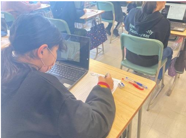
▶ 4年生：朝のドリルタイムの様子。格納された問題の回答はシートに記述します。

今回は端末に格納されている学習ドリルに取り組む様子やリモート授業、また、学習活動ではありませんが、校内一斉で実施した児童アンケートに取り組む様子をお伝えします。