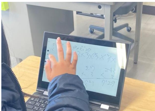
▶ 6年生：単元テストや課題が早く終了した時にAIドリルに取り組んでいます。