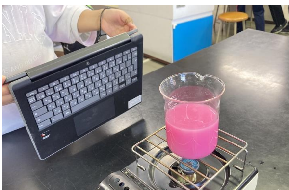
▶ 4年生：リモートでお休みした友だちに実験の様子を配信しています。