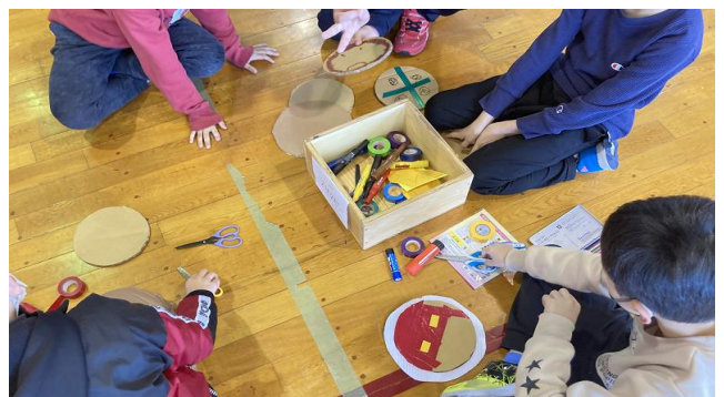
■フリスビーを作るグループ