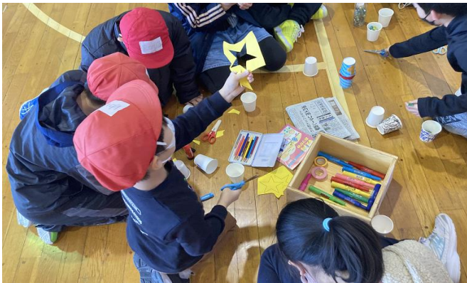
■「カエルとばし」を作るグループ

3年生がみずほ学級のお友達と触れ合う「いずみ交流」を行いました。“話そう、知ろう、なかよくなろう”をテーマにして、子ども達は6つの班に分かれてそれぞれおもちゃを作り、「おまつりワッショイ」のお店を訪れて遊ぶ体験をしました。みずほ学級のお友達の名前を覚えて、最後まで楽しく交流することができました。