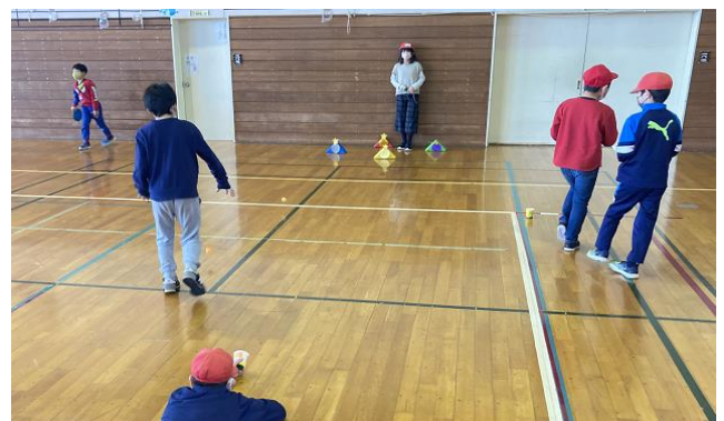
■紙コップしゃてきコーナー