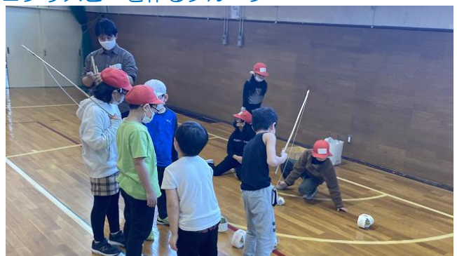
■ヨーヨーつりコーナー