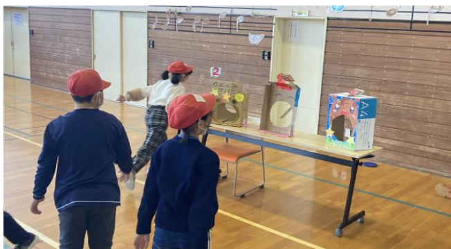
■フリスビーコーナー