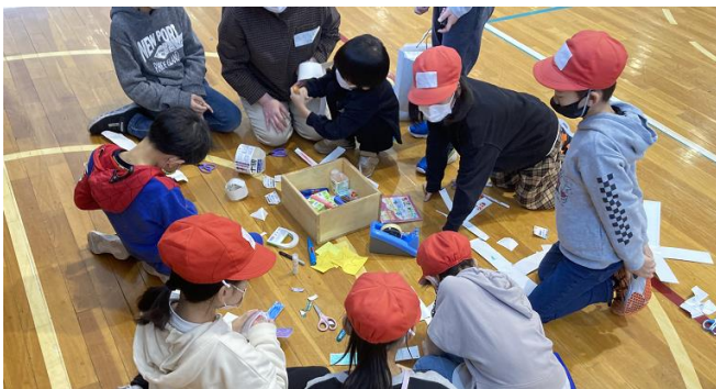
■「ヨーヨーつり」のヨーヨーを作るグループ