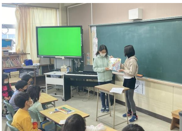
1年生 ■ 図書委員による読み聞かせ