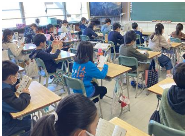
■ 朝読書 4年生