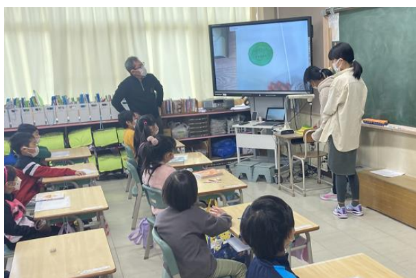
1年生 ■ 図書委員による読み聞かせ