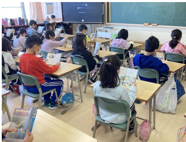
■ 朝読書 2年生

本校では“読書の秋”にふさわしく、11月14日より全校で読書週間を実施します。図書委員会の児童も関わり、読書の良さを知ってもらい、一人でも多くの子どもたちに“本好き”になってもらおうという企画です。その読書に関する活動の様子をお伝えします。