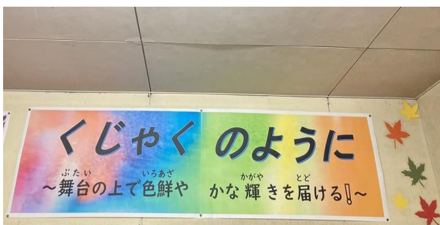
■ 掲示された学習発表会テーマ