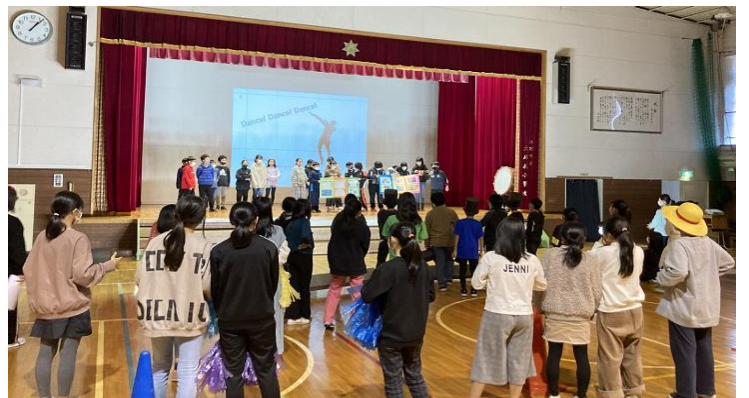
■感想交流 5年生から6年生へ