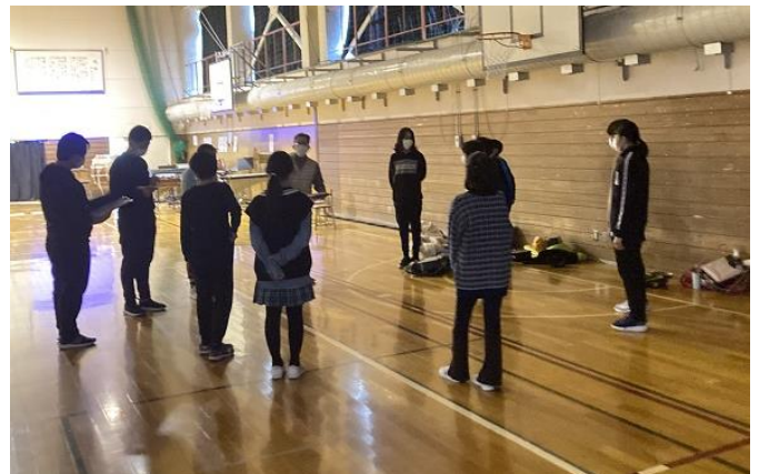
■企画学習での最終確認 ～放送係と舞台係～