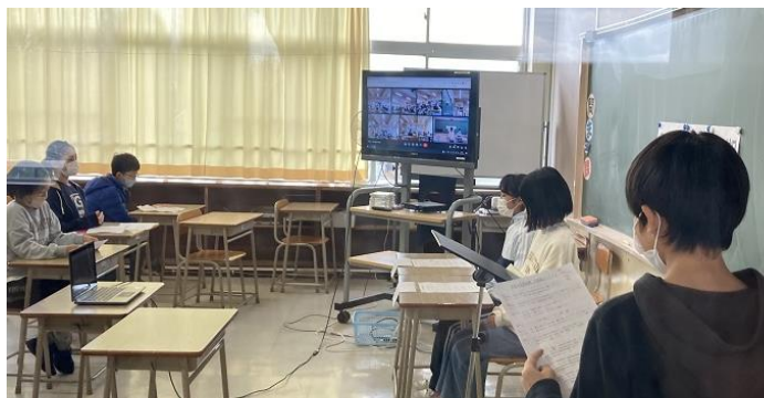
↑ 3F 特別教室で総会を行いました

後期の児童総会を開催し、4年生以上が参加しました。今回もコロナ感染対策のためリモートで行いました。2名の議長による進行で書記局や各委員会のめあてや活動内容の紹介がありました。書記局と5つの委員会から、新しい企画や重点的な取組が全部で14点提案されました。その後、5年生や4年生からも質問や意見が活発に出され、委員長が丁寧にわかりやすく答えていました。最後に校長先生から、書記局や各委員会の企画、取組に全員が全力で協力して、さらにやさしい、笑顔いっぱいの学校にしていきたいと思いますとお話がありました。