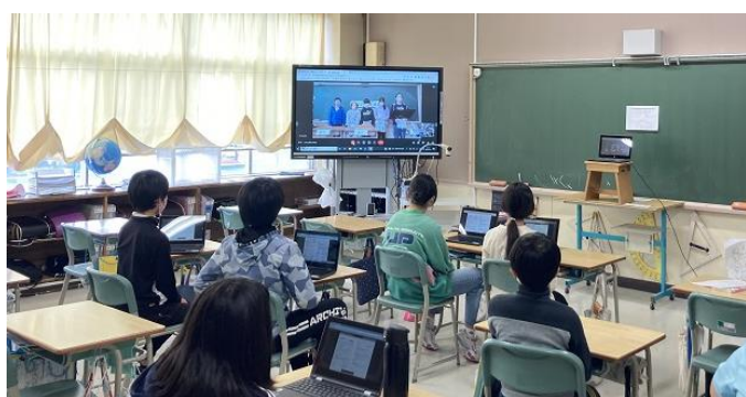
↑ 各教室ではタブレットを視聴しながら総会に参加しました