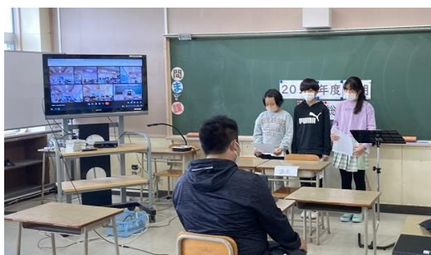
↑ 書記局による閉会の言葉