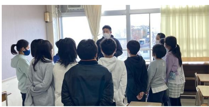
↑ 参加児童による反省会 ～皆さんの態度は立派でした～