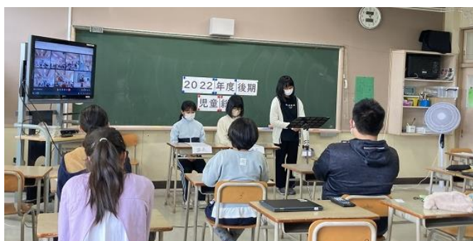
↑ 書記局・各委員長による活動紹介の様子