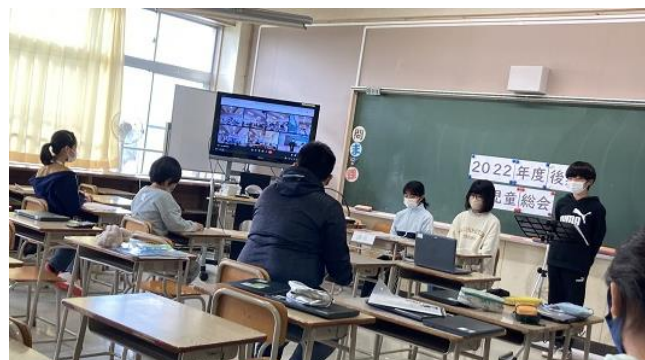
↑ 書記局・各委員長による活動紹介の様子