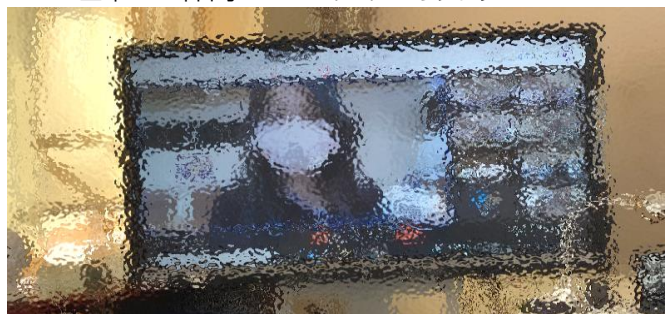
～保護者様の顔と声が黒板に映し出されます～