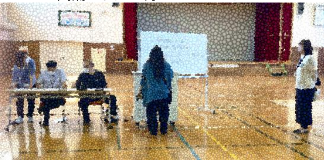
～カメラに向かいお子様の名前等を話します～