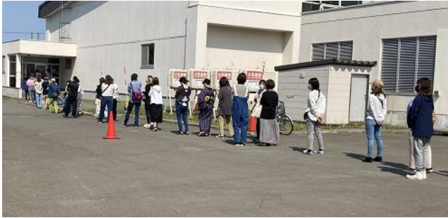
～間隔をあけて、待っていただきました～

▶ 保護者引き渡し訓練 災害時における保護者引き渡し訓練を実施しました。コロナ感染対策を考慮し、また、保護者様のご理解とご協力をいただきながらスムーズに行うことができました。