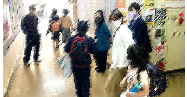
～待合場所で児童を保護者様へ引き渡します～

▶ 避難訓練 今回は火事を想定して訓練を行いました。児童は避難の仕方や話の聞き方・姿勢、教室までの移動、最後まで真剣に緊張感を持って訓練に向かい、その姿にとても感心しました。避難する時のキーワードである『おはしもち』を全校で確認しました。