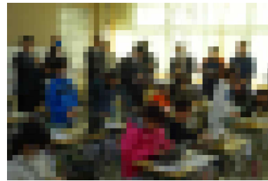
研究授業をした4年2組