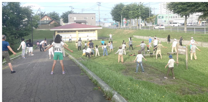
～北栄会館緑地公園でのラジオ体操の様子～

夏休み中、学校近くのかしわ公園、若葉公園、ひよどり公園、北栄会館緑地ではラジオ体操が行われ、役員を含めた大人の方々と一緒にたくさん子どもたちが参加していました。夏休み前にいくつかの自治会の役員の方々から、コロナが完全に収束しない中、ラジオ体操や夏まつり、神社祭の神輿かつぎなどの開催について、相談を受けました。「地域子どもたちに少しでも楽しんでもらいたい」との思いから発せられる言葉にとっても感激し、ぜひ、前向きに進めてほしいとご返答しました。“子どもたちは地域の中で育つ、地域が子どもたちを育てる”という言葉があります。家庭や学校はもちろんですが、「土曜広場」をはじめ、子どもたちのために住民の方々が協働し合い活動していただいています。子どもたちに向けた関心の高さに改めて敬意を表し、感謝申し上げます。