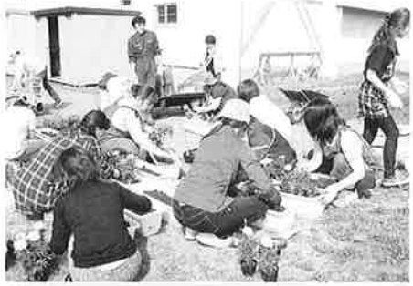
厚生部 花いっぱい運動 (6/10)