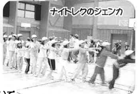
ナイトレクのジエンカ