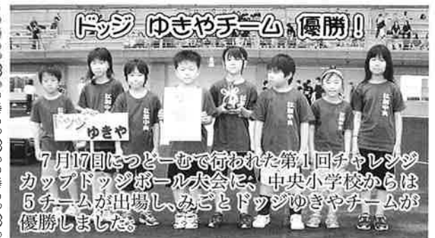
7月17日につど一むで行われた第1回チヤレンジカップドッジボール大会に、中央小学校からは5チームが出場し、みごとドッジゆきやチームが優勝しました。