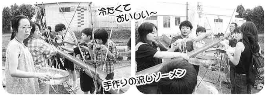
冷たくておいしい～