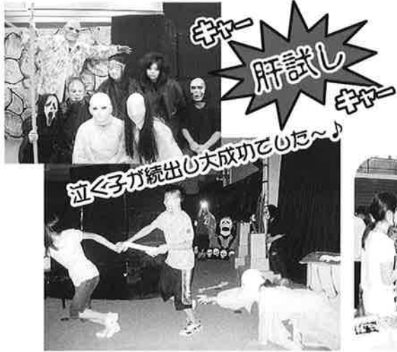
キャー 肝試し キャー