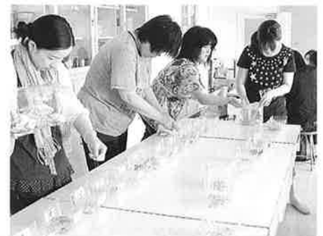
クラス委員会 ベルマーク活動 (6/21) (7/14)