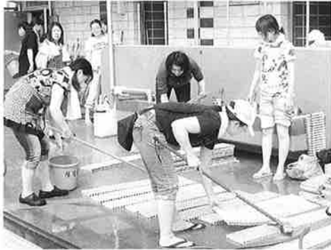
厚生部 プール清掃 (6/14)