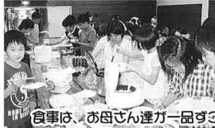
食事は、お母さん達が一品ずつ持ち寄ってくれました～♪