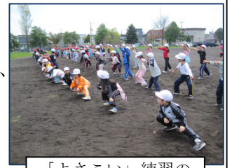
「よさこい」練習の 一コマ（低学年）

運動会の公開まで、数日と迫り、仕上げにはもう一踏ん張りど、これまでも増して練習に熱が入る教職員と子ども達。努力、協力、規律の大切さを学び、成長を遂げていく子ども達です。